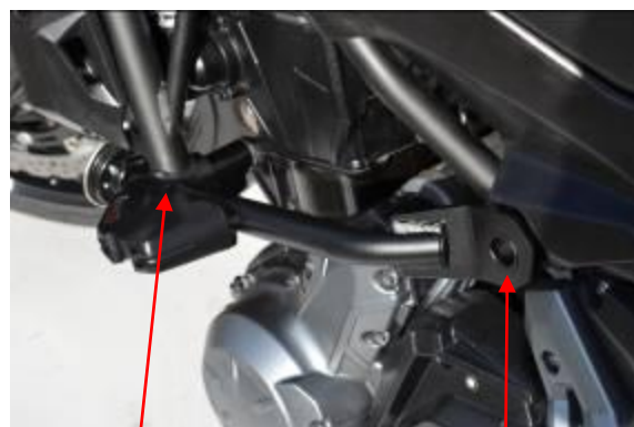
Vis de fixation moteur gauche