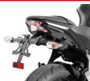
Support de plaque