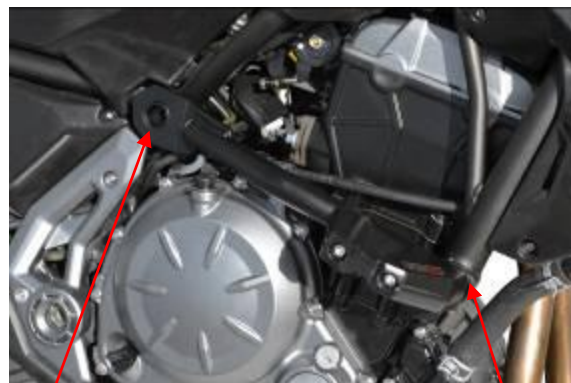
Cache plastique d'origine