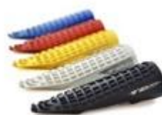
Repose pieds Av et Ar