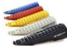
Repose pieds Av et Ar