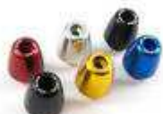
Embouts de guidon