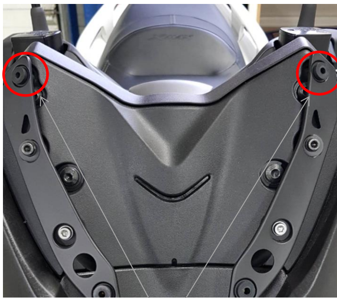
Position des entretoises plastique