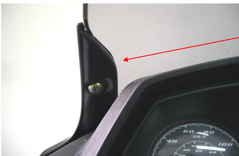
Fitting for the Downtown 125I / 300I ABS 2015 only