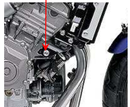
Emplacement de fixation